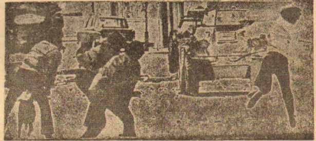
Militarist kuvvetler ve polis, faşizmin vurucu gücüdür

İkinci kategoriye giren ülkeler tarihsel, ekonomik, sosyal yönden geri olduklarından, demokratik devrimlerini gerçekleştirilememişlerdir. Bu ülkelerin burjuvaları, ekonomik yönden güçsüz, borsalarının zayıf oluşu nedeni ile devleti borsalar yoluyla kontrol edememişlerdir. Feodalizme karşı devrimci bir tavır takınmadıkları için, feodaller ve diğer anti-demokratik güçlerle işbirliği yapıp, iktisat—dışı cebre