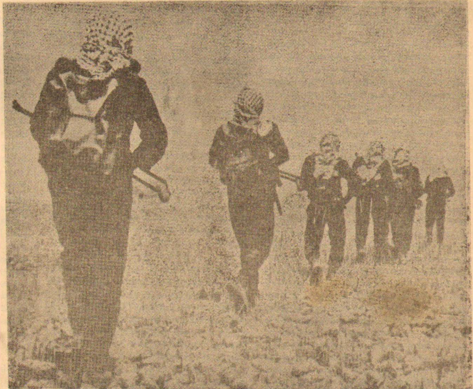
ZAFER «KAZANACAĞIZ» DİYE SAVAŞA ATILAN VE SABAH GİZLİNE ÇIKARILAN GİBELİNDE SİLAHLI ÖLÜME GİDEN FİLİSTİN HALKININ OLACAKTIR

Tarih, Türkiye halklarına Ortadoğu'da intihar saldırısına geçen emperyalizme karşı direnmek ve onu yok etmek görevini yüklemiştir. Türkiye halkı tarihini kendine vermiş olduğu bu sorumluluğu mutlaka yerine getirecektir. Devrim bayrağını burjuvazinin burcuna dikmek için mücadele verirken şehit düşen devrimcilerin, bizlere emanet ettikleri devrim bayrağı burjuvazinin burcuna mutlaka dikilecektir.